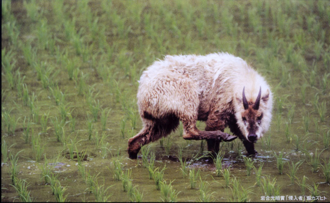
岩合光昭賞「侵入者」堀カズヒト