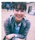
□烏飼 祥恵 / 写真家

東京出身。ジバンシーにスカウトされパリコレなど、国際的なモデルとして活躍後、1990年「サーカスの少年」を出版し写真家に転身。広告、雑誌連載、文筆や講演、多ジャンルの審査員、ビジュアルプランから映像監督まで幅広く活躍。ライフワークとして、「ビューティフル トゥモロウ 少年少女の世界」、「Invisible Kyoto」、「氷河期」を撮影中。6月美術館えきKYOTOで安珠写真展「Invisible Kyoto 目に見えない平安京」に続き、「Invisible Kyoto -Tokyo edition」をライカGINZA SIX 5Fで9月24日迄開催。 https://www.anjujp.com